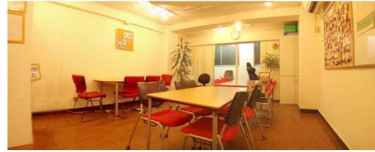
秋葉原の小さな教室。全くの素人さんでも、1日でプログラミングができる講座を展開。