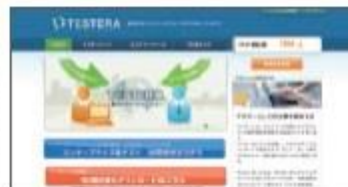
「TESTERA」は、オンデマンドでソフトウェアのテストを実施するサービスです。