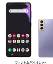
ファントムバイオレット